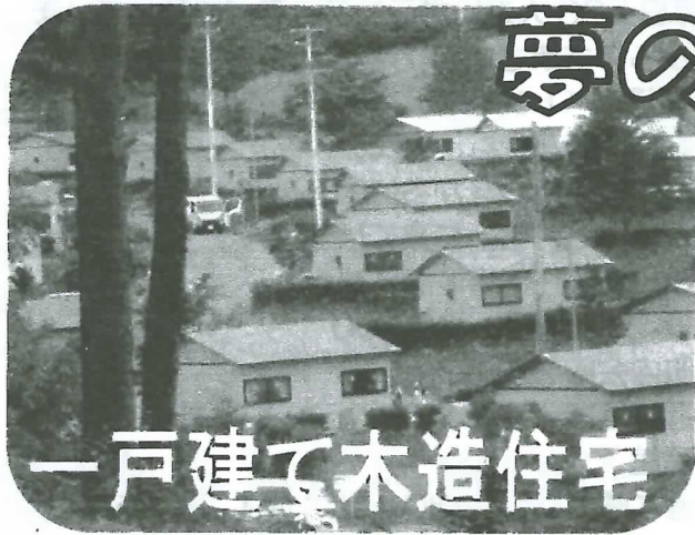
一戸建て木造住宅

発行：気仙市民復興連絡会 大船渡市末崎町字石浜 34-1 http://kesen-chiku.ecom-plat.jp/ Twitter @KesenShiminFR