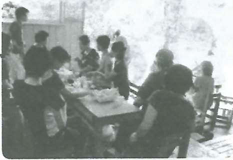
近隣の下有栖小学校でお茶っこ