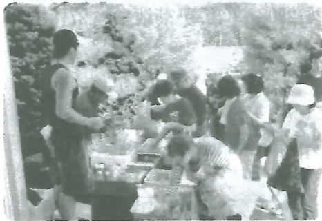
新鮮野菜は市場価格の半額以下で販売

仮設住宅で生活をスタートされた人たちにとって大切なこと。そのうちのひとつが住民同士のコミュニケーション。